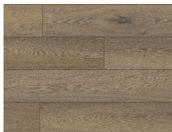
Panel Podłogowy wodoodporny Bourbon Cask R076