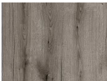
Płyta meblowa laminowana Dąb Evoke Kamienny K366 PW